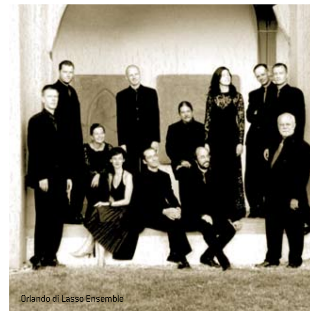
Orlando di Lasso Ensemble

Lassos Schwanengesang, ein Zyklus geistlicher Madrigale auf Texten von Luigi Tansillo (1510–1568) ist eine hochexpressive Musik, die der Komponist erst kurz vor seinem Tod fertigstellte. Die dramatische geistliche Musik erlebte nach dem Tridentiner Konzil einen deutlichen Aufschwung. Manieristische Äußerungen einer neuen Expressivität werden in diesem Zyklus gekonnt mit einer langen musikalischen Tradition vereint, um den inneren Schmerz des Petrus darzustellen, in einer Tonsprache, die uns genauso aufrüttelt wie damals die Zeitgenossen Lassos.