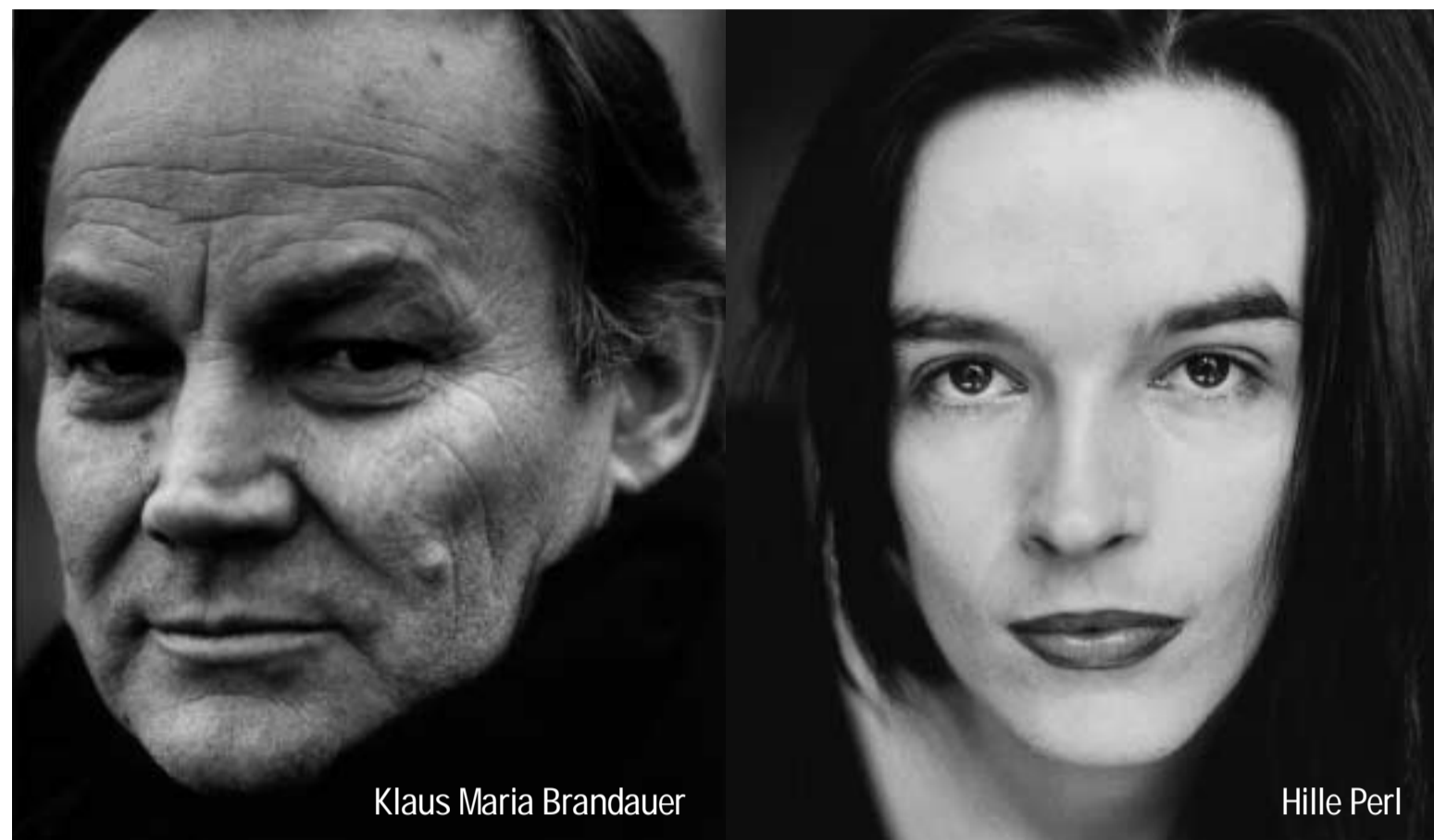
Klaus Maria Brandauer